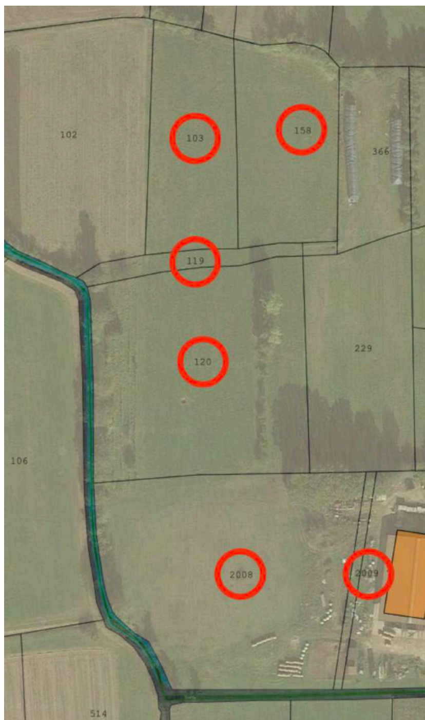
Sovrapposizione tra ortofoto e mappa catastale.

sovrapposizione siano da imputare alle deformazioni insite nella generazione dell'ortofoto che utilizza parametri cartografici diversi da quelli della mappa catastale.