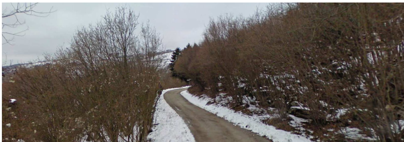
Panoramica terreni da strada che li attraversa