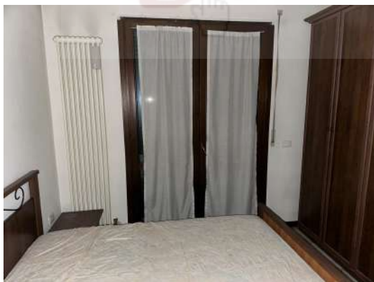
Camera da letto.