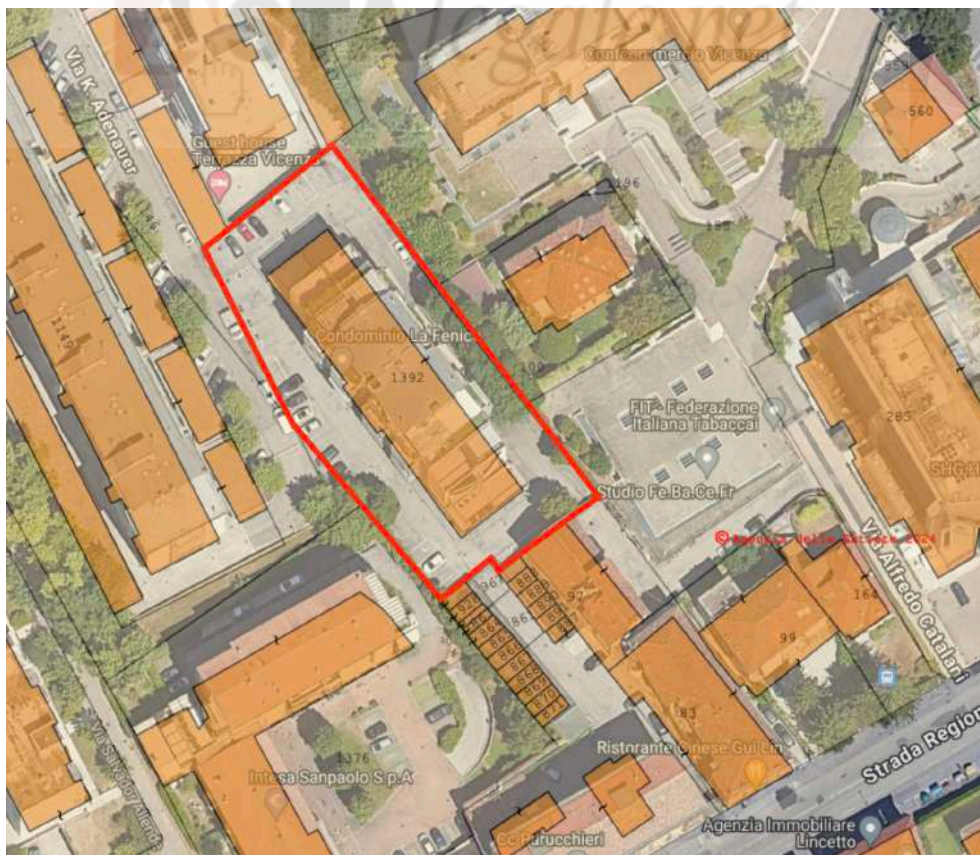
Sovrapposizione tra ortofoto e mappa catastale.

La scheda catastale N.C.E.U. che descrive l'appartamento (Sub 95) non riporta il muro che dovrebbe delimitare l'antibagno, presente sul progetto approvato e mancante anche sul posto. Va aggiornata la scheda catastale con costi a carico del futuro acquirente. Sono fatte salve le normali tolleranze del 2%. Per le operazioni di aggiornamento catastale di stima un costo indicativo e di massima di circa 1.000,00 €.