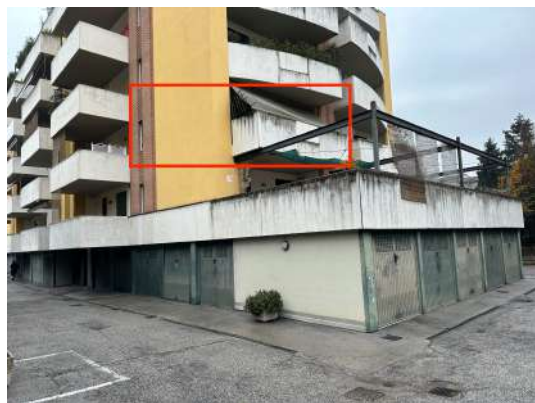
Vista da sud-ovest.

Fanno parte dell'edificio gli spazi in comune con le altre unità immobiliari quali area di corte scoperta con spazio di manovra, vano scale, ascensore, corridoi, locali contatori, ecc.