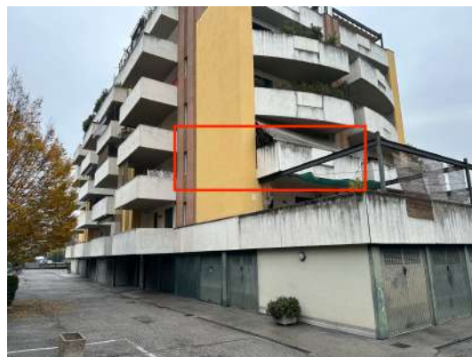
Vista da sud-ovest.