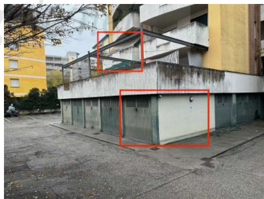
Vista da sud-est.

L'edificio è stato costruito nel 1999/2000 e da allora non pare aver subito modifiche o manutenzioni significative. L'abitabilità/agibilità è del 2001. La tipologia costruttiva è quella tipica del periodo, con strutture portanti in cls. armato, murature in laterizio, solai in latero-cemento, tetto in parte piano e in parte a padiglione con varie soluzioni di copertura (guaina, lamiera, ecc.) e latorneria in lamiera; le pareti interne sono in laterizio intonacato e tinteggiate; le pareti esterne sono intonacate e tinteggiate, e in parte presentano inserti in mattoni faccia vista.