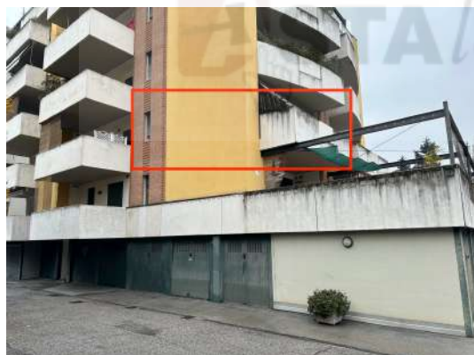
Vista da sud-ovest.