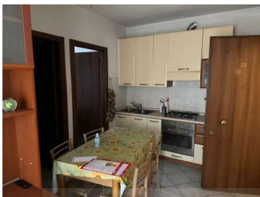
Cucina e ingresso.

Le aree esterne (in comune con altre unità immobiliari) presentano pavimentazioni in asfalto; sono presenti alcune aiuole con essenze arboree. L'insieme appare in condizioni di manutenzione appena sufficienti, con segni di usura compatibili con la vetustà dell'edificio, anche se alcuni elementi (tinteggiature esterne, basculanti dei garage, ecc.) si presentano piuttosto trascurati.