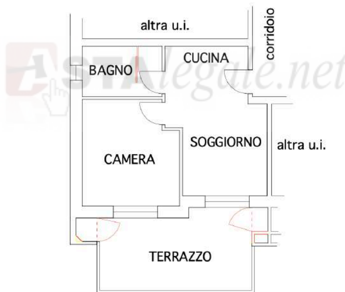
Pianta piano secondo con evidenziate le difformità (non in scala).

Il CDU è stato richiesto e non è ancora stato rilasciato. Sarà integrato appena disponibile.