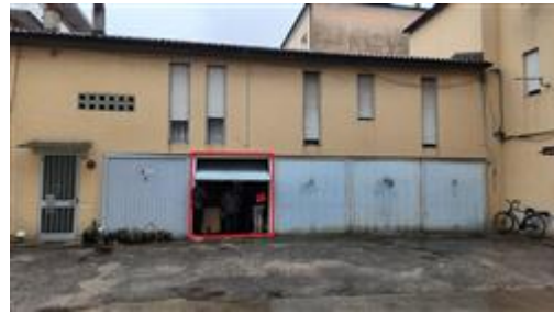
vista autorimessa da corte interna