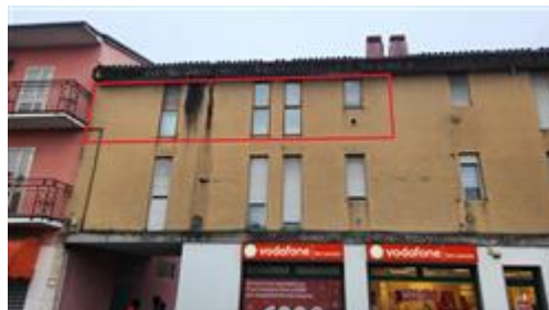
vista abitazione da Via San Lazzaro