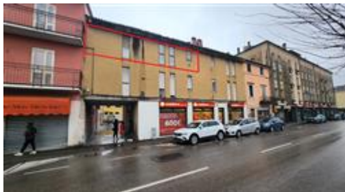
vista abitazione da Via San Lazzaro

Si evidenzia che la sig.ra *** DATO OSCURATO *** ha cambiato i propri dati anagrafici in " *** DATO OSCURATO *** " ed il Codice Fiscale " *** DATO OSCURATO *** " è stato sostituito con " *** DATO OSCURATO *** ".