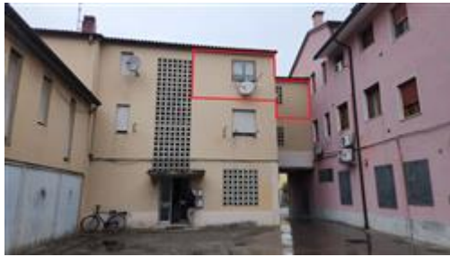
vista abitazione da corte interna