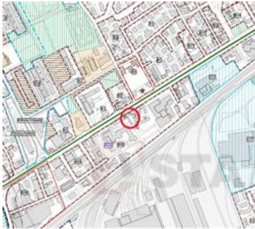
estratto Piano degli Interventi

I beni sono ubicati in zona semicentrale, in un'area mista residenziale/commerciale e le zone limitrofe si trovano in un'area mista. Il traffico nella zona è sostenuto ed i parcheggi sono scarsi. Sono inoltre presenti i servizi di urbanizzazione primaria e secondaria.