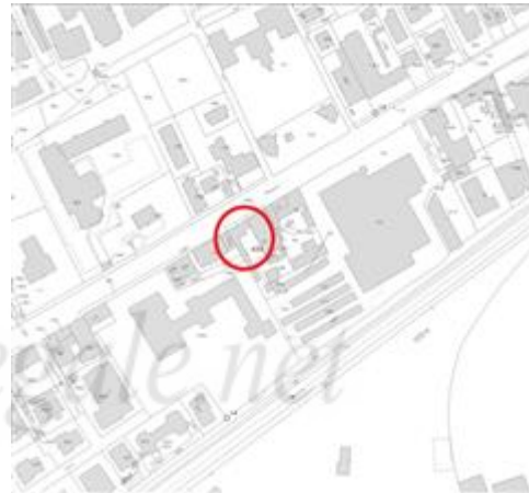
estratto Mappa Catastale