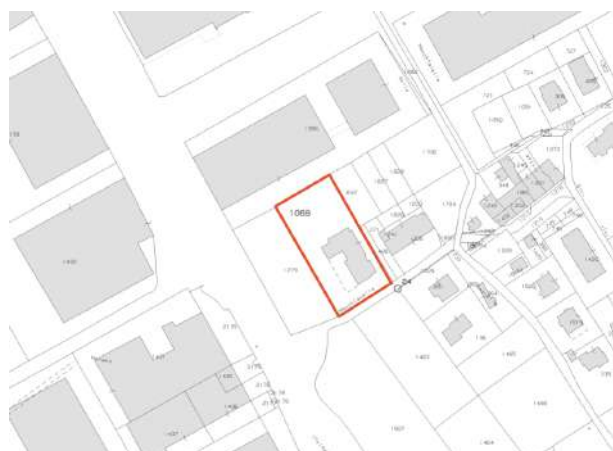
estratto di mappa – foglio 19 – mappale n. 1069

Il fabbricato, in cui sono inserite le unità immobiliari, è posto su lotto di terreno catastalmente individuato all'U.T.E. di Vicenza al C.T. in Comune di Schio (VI) al foglio 19 – mappale n. 1069 (ente urbano) di superficie catastale pari a mq. 2.621 posto tra i confini Nord in senso N.E.S.O.: m. n. 1386; mm. nn. 647 – 406; strada Macchiavella; m. n. 1279.