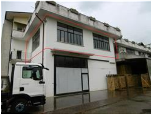
Prospetto est (con individuazione porzione in oggetto)