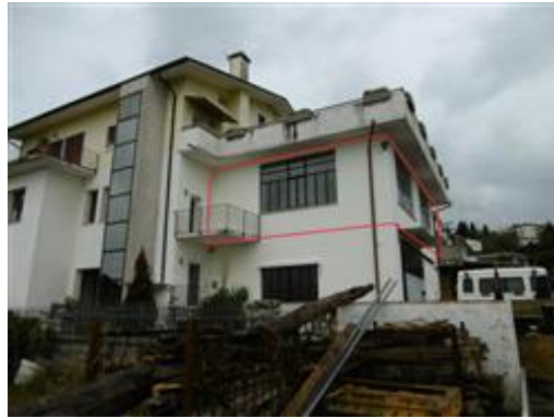
Prospetto sud (con individuazione porzione in oggetto)