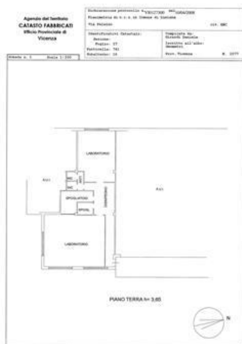
Planimetria catastale mappale 741 sub. 16

8.3. CONFORMITÀ URBANISTICA: NESSUNA DIFFORMITÀ