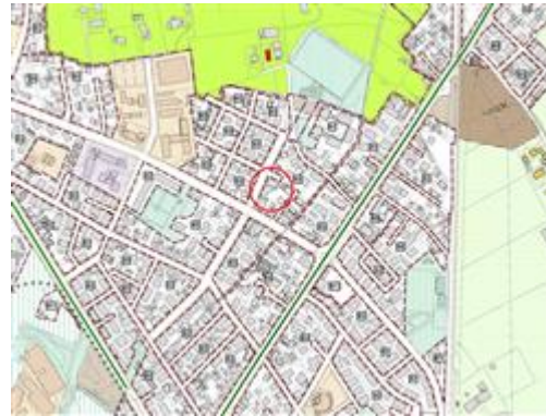
Piano degli Interventi