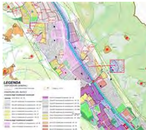
Estratto strumento urbanistico