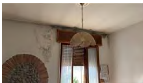
Soggiorno - infiltrazione dal tetto