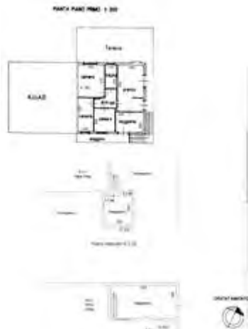
Stato dei luoghi